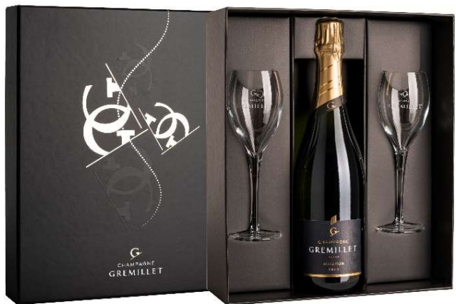
Le coffret Mixte 1,2 ou 3 bouteilles