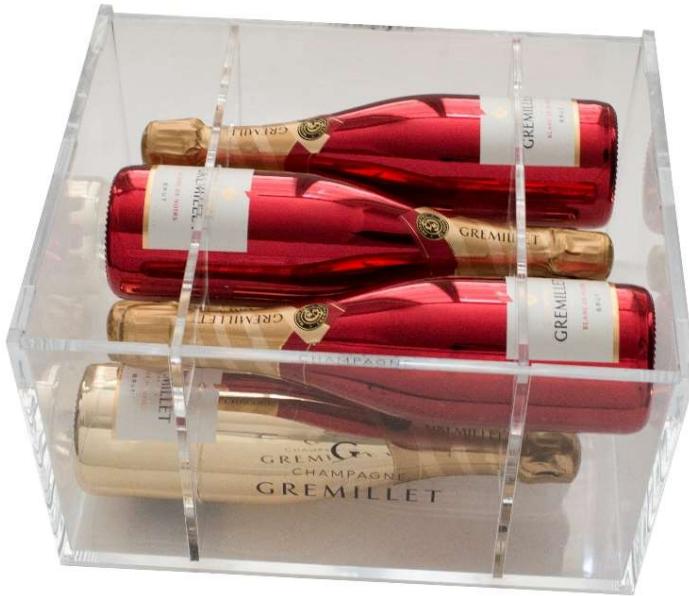
La Vasque magique